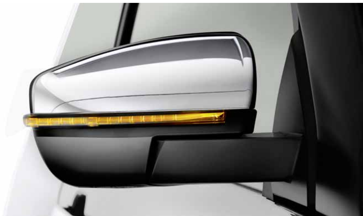
Aussenspiegel mit LED-Blinker, Serie ab Premium